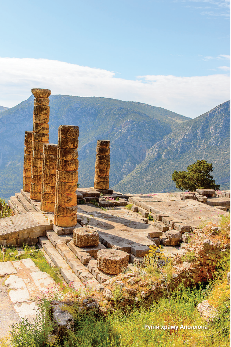
Рүіні храму Аполлона